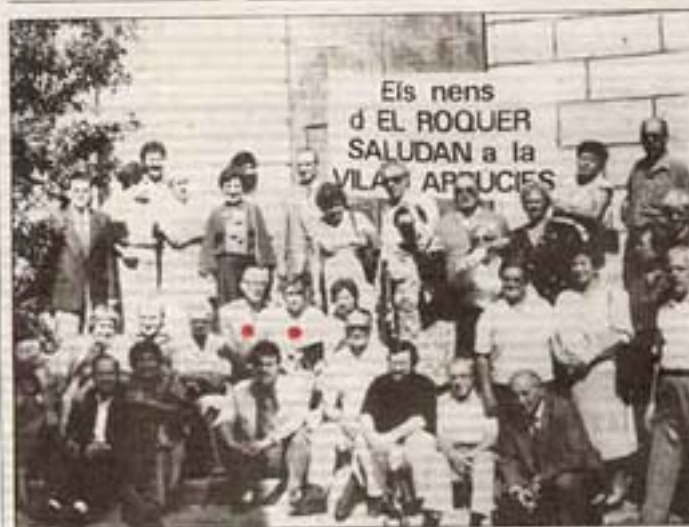
Els refugiats es van emocionar quan van veure Arbúcies cinquanta anys després.